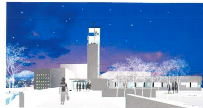
Lindakirkja að kvöldlagi.