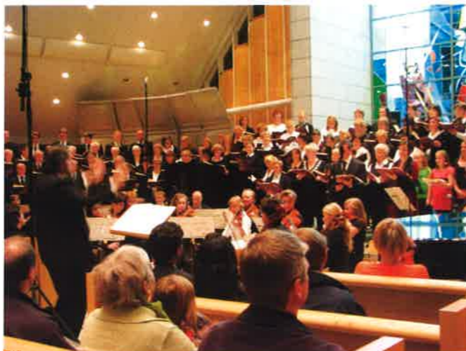
Mass of the Children