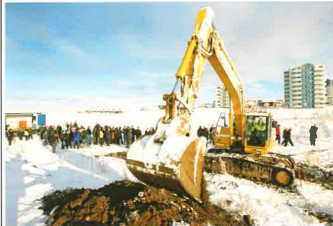
Fjöldmenni var við skóflustunguna þennan fallega vetrardag.

Að athöfn lokinni var viðstöddum, sem voru um 250 talsins, boðið að þiggja kaffisopa og kleinur í safnaðarheimilinu og skrifa nafn sitt í gestabók.