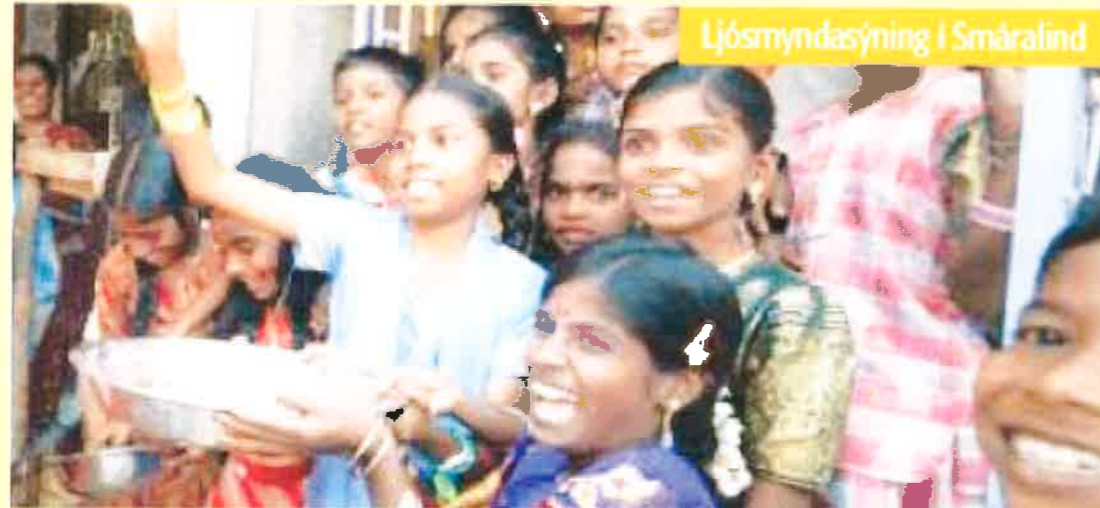
Ljósmyndasýning í Smáralind

HELGIHALD Í SUMAR Sameiginlegar guðsþjónustur Linda-, Digraness-, Kársnes- og Hjallasafnaða verða alla sunnudagsmorgna kl. 11 frá júnibyrjun til ágústloka sem hér segir: Júní í Hjallakirkju, júlí í Kópavogskirkju og ágúst í Digranes Kirkju. Prestar safnaðanna skiptast á með að þjóna í guðsþjónustunum.