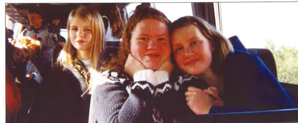
Í rítunni á leið heim úr Vatnaskógi