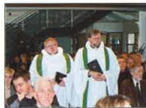
Fyrsta guðsþjónustan í nýrri sókn

Heimavinnandi mömmur, börnin þeirra og aðrir áhugasamir athugið! Þriðjudaginn 10. desember kl. 11 verður sérstök kynning á fjölskyldumorgnum (kölluðust einhverntíma mömmumorgnar) sem hefja munu göngu sína strax eftir áramót. Fjölskyldumorgnarnir verða haldnir í safnaðarheimilinu, sem er á kirkjulóðinni, Uppsölum 3. Kynningarmorguninn verður í anda adventunnar, boði verður upp á piparkökur og kakó og létt spjall.